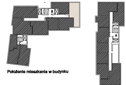
Położenie mieszkania w budynku

Warszawa, ul. Dionizosa 7c piętro 2 | klatka B