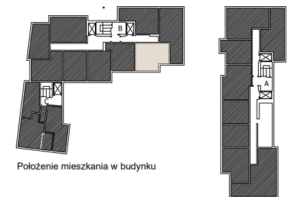
Położenie mieszkania w budynku

Warszawa, ul. Dionizosa 7c piętro 3 | klatka B