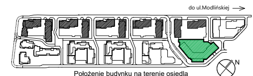
Położenie budynku na terenie osiedla

DATA SPORZĄDZENIA KARTY: 14.09.2023r. DATA AKTUALIZACJI KARTY: