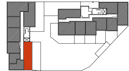
Położenie mieszkania w budynku

Warszawa, ul. Dionizosa 6A piętro 1 | klatka A